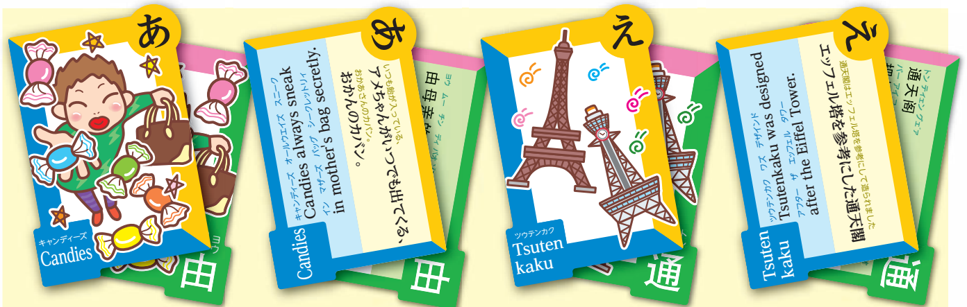
第4回メディア・ユニバーサルデザインコンペティション 一般の部 最優秀賞(グランプリ) [MUD大阪アラッ?カルタ] 株式会社ケーエスアイ・MUDプロジェクトチーム(大阪府)