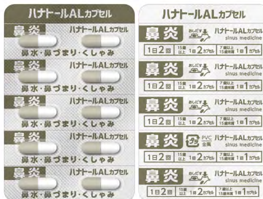
PTP 包装シート (表面 / 裏面)