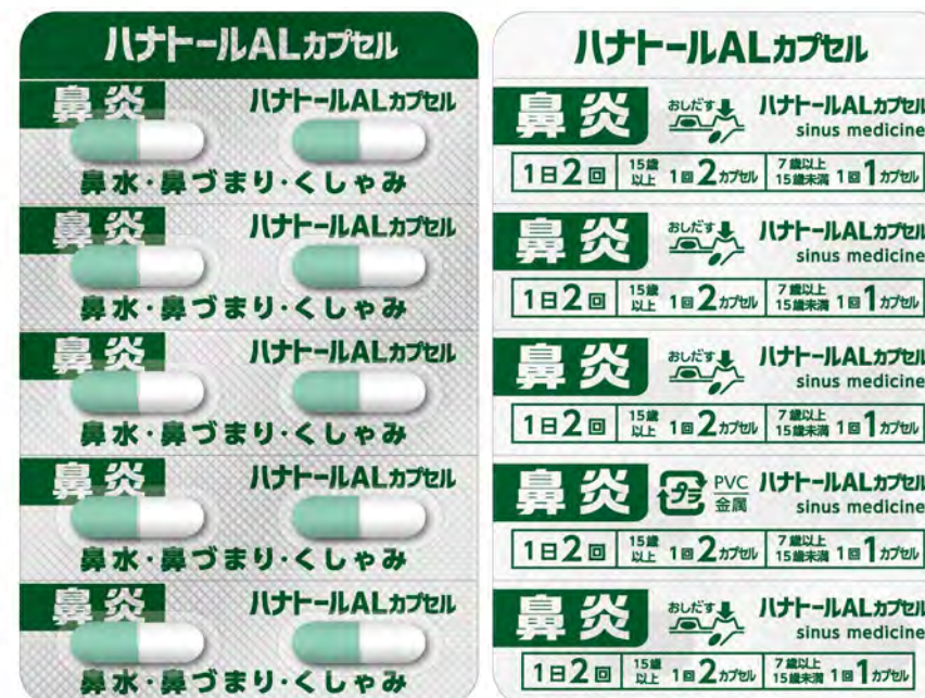
PTP 包装シート (表面 / 裏面)