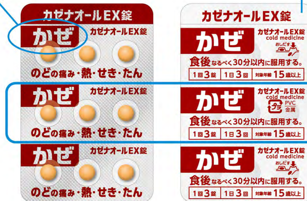
PTP 包装シート (表面 / 裏面)