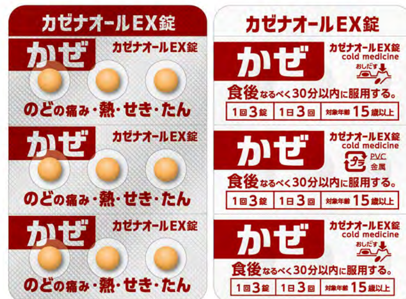
PTP 包装シート (表面 / 裏面)