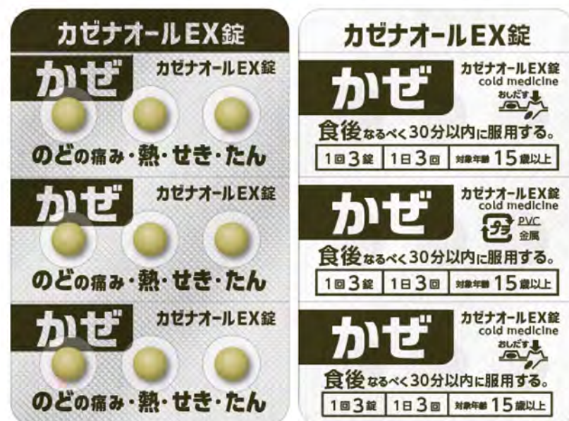
PTP 包装シート (表面 / 裏面)