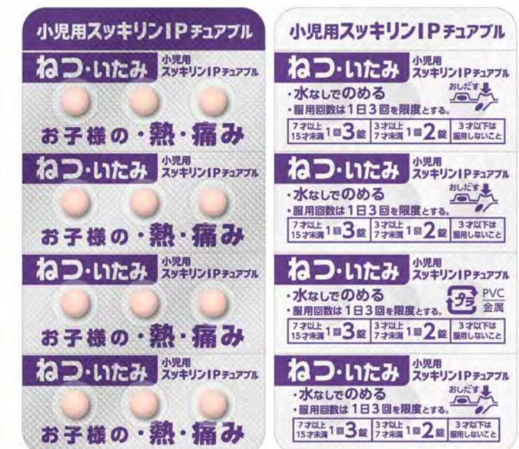
PTP 包装シート (表面 / 裏面)