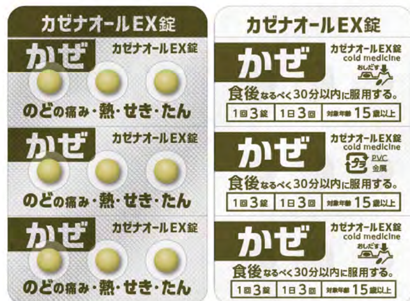
PTP 包装シート (表面 / 裏面)