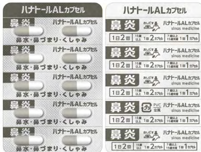
PTP 包装シート (表面 / 裏面)